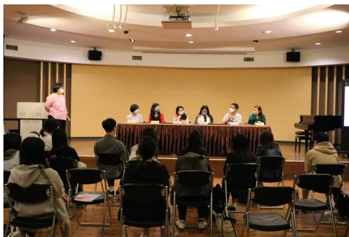
綜合座談 音樂與跨域的發展