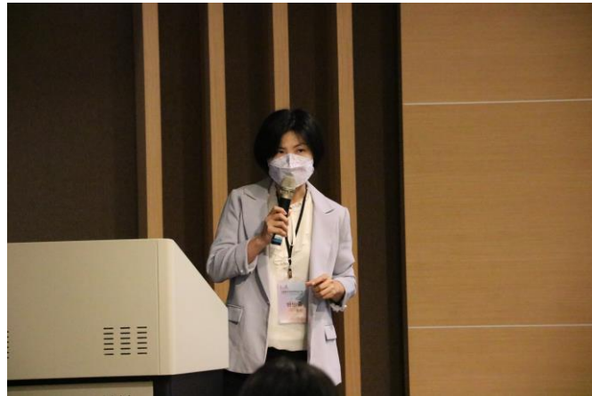
論文發表(六) 現代合唱音樂創作特色- 以 Dan Forrest 的作品『Jubilate Deo』為例 曾怡蓉