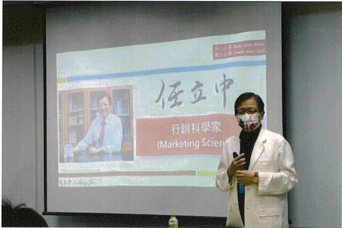
(任立中教授專題演講)