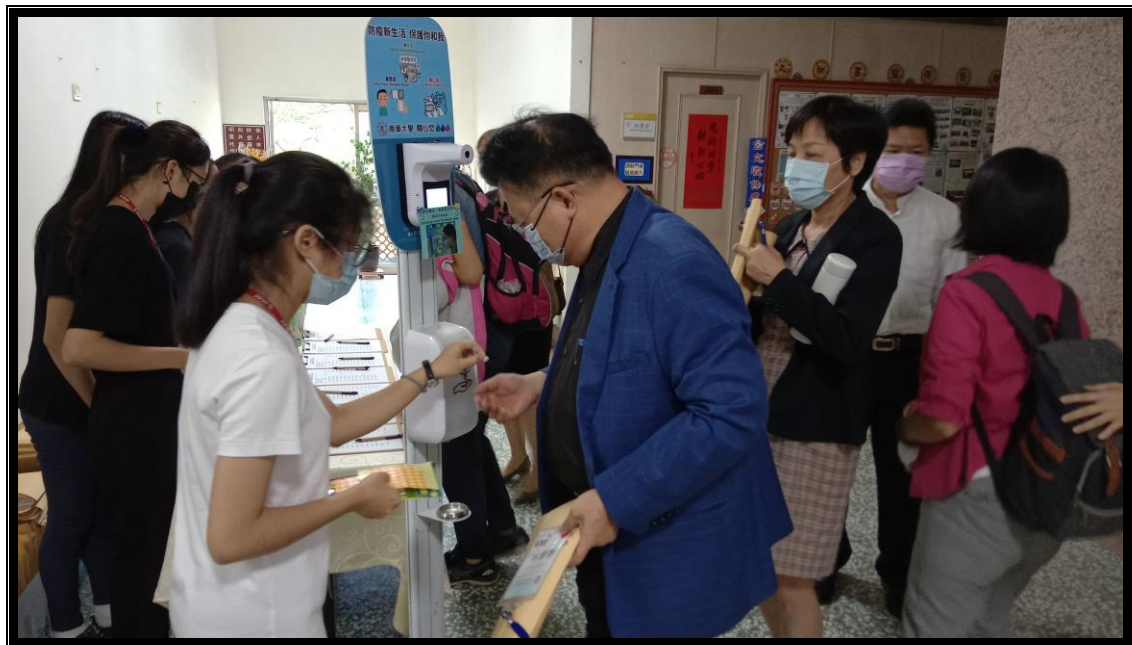
因應防疫檢測體溫與噴酒精