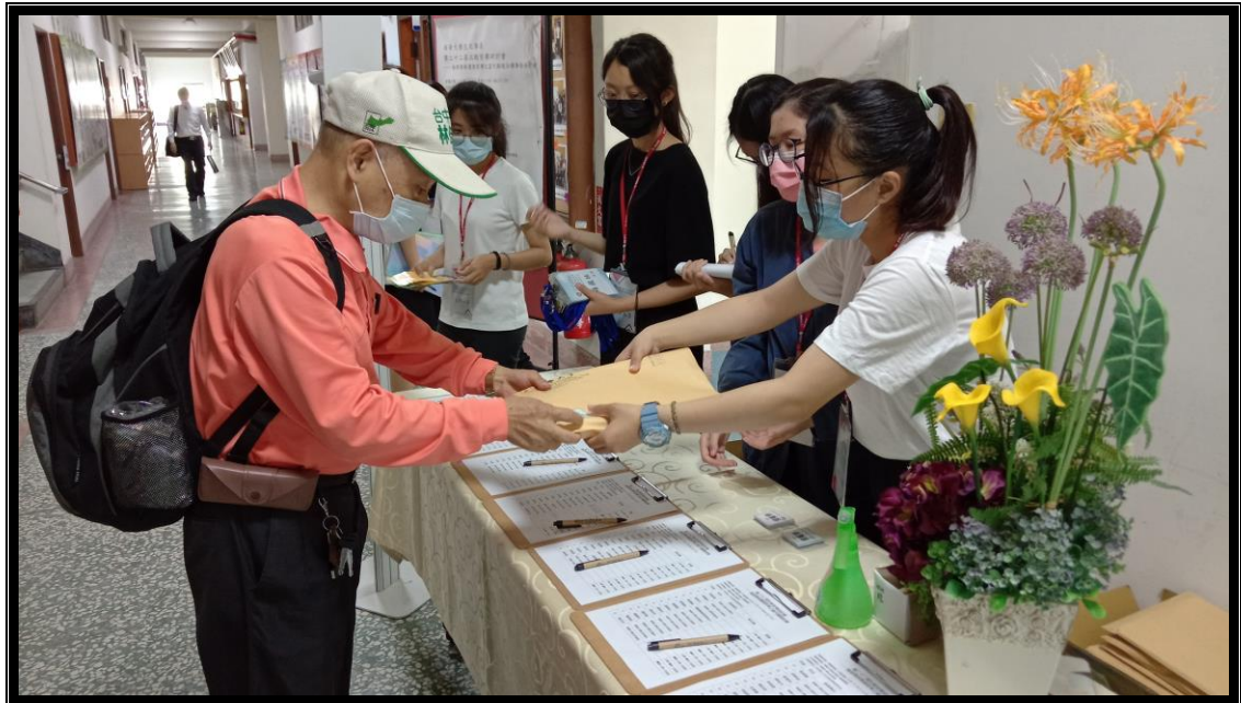
發送與會來賓會議資料