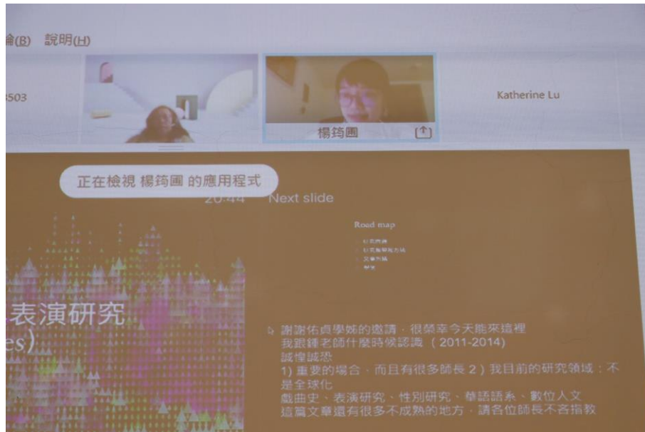
發表人：楊筠圃（以 Webex 線上發表）