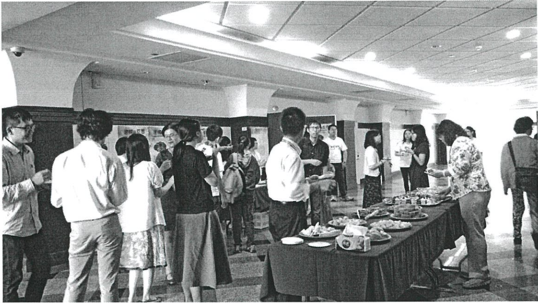
圖說:下午茶敘時間與會貴賓彼此交流熱絡