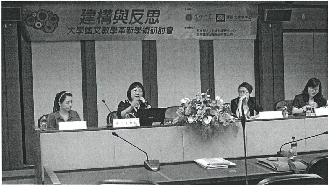
圖說:第四場次國文教學與數位科技