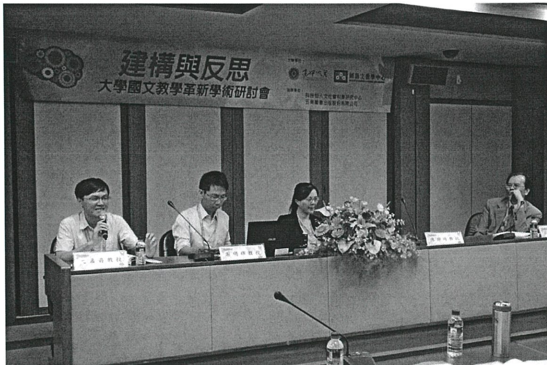
圖說：第一場次國文教學與人文精神