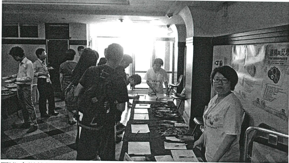
圖說：會場外報到處工作情況