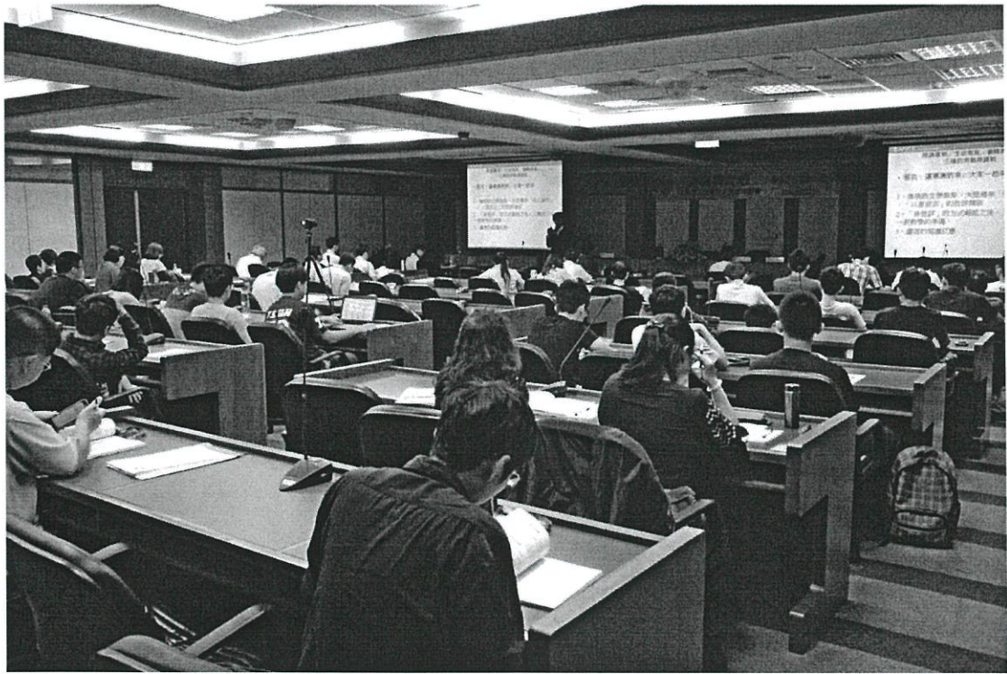
圖說:發表人宣讀論文時之會場全貌