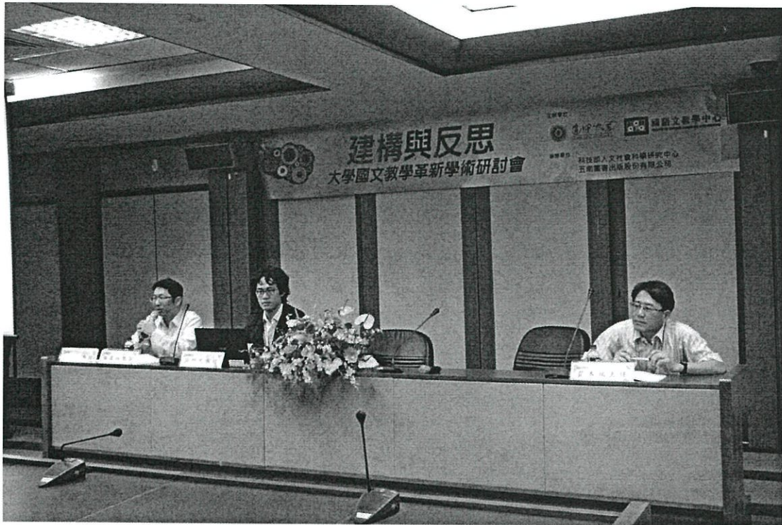
圖說：第二場次國文教學與翻轉教室