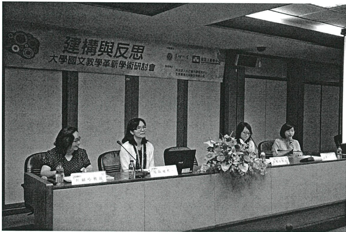
圖說:第三場次國文教學與敘事力